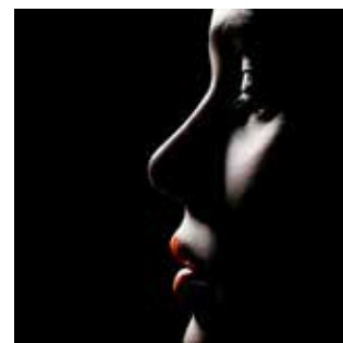
Photo mode et beauté en extérieur p. 11-13 en studio p. 14-16